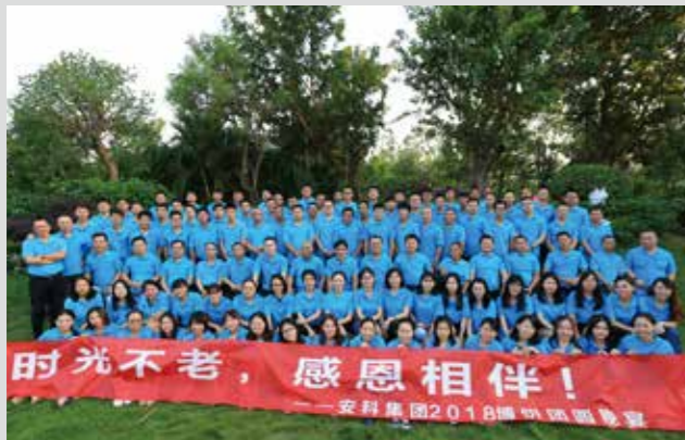
2018厦门安科中秋博饼