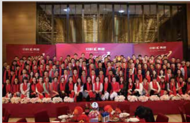
2017厦门安科年终盛宴