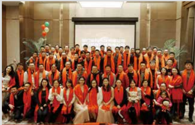
2016年厦门安科年终尾牙