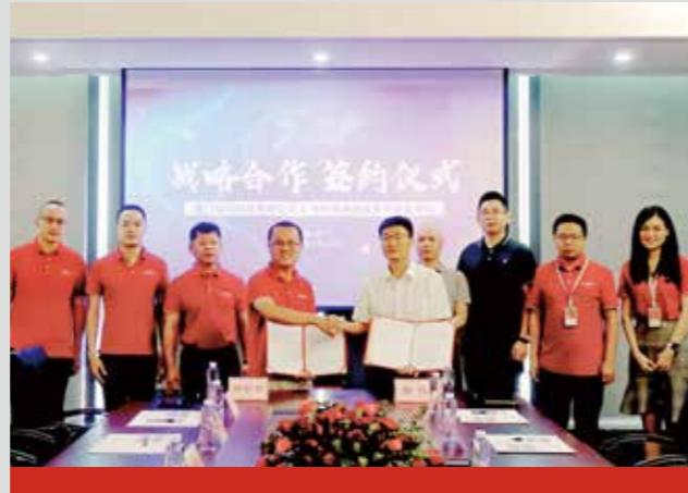
厦门安科与中科院泉州装备制造研究中心达成战略合作