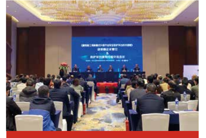
由厦门安科主办,中国工程建设标准化协会施工安全专业委员会组织的《建筑施工用附着式升降作业安全防护平台技术规程》送审稿征求意见及防护平台使用经验交流会议在厦门召开