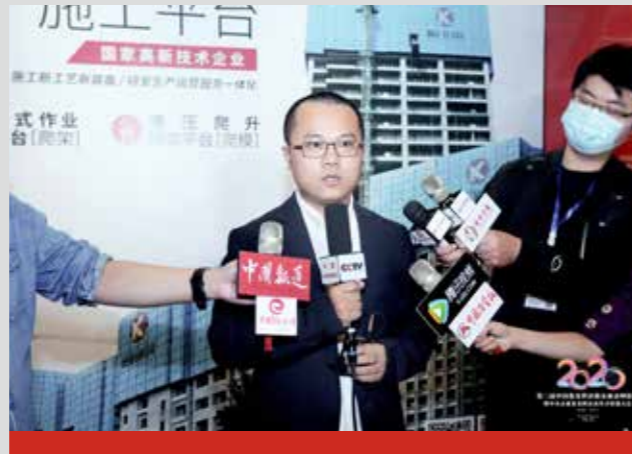
参加第三届中国集采供应链企业高峰论坛暨中央企业集采供应商共享招募大会,并获得了“2020中央企业集采供应商50强”荣誉称号,接受中国网等多家新闻媒体采访