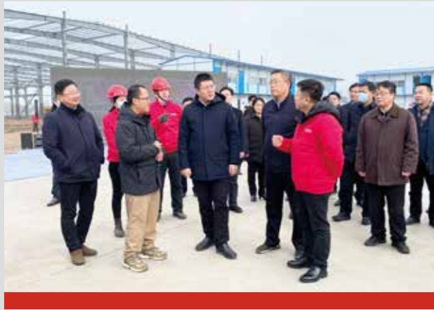
芜湖市委书记、市长率市领导班子莅临厦门安科安徽芜湖基地走访调研