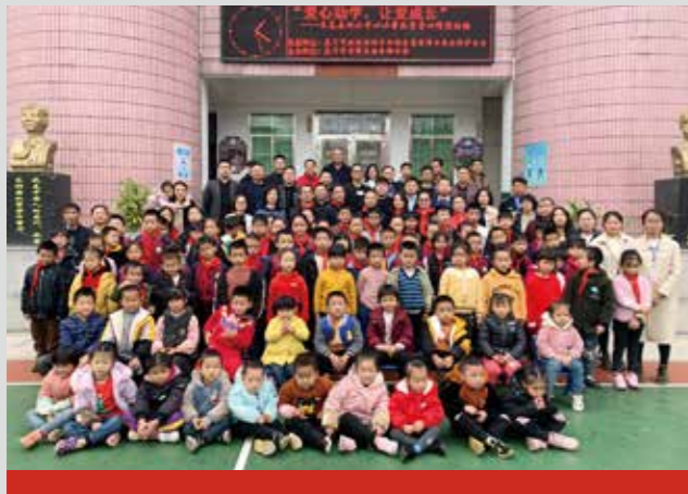
厦门安科组织开展“爱心助学,让爱成长”扶贫捐赠活动