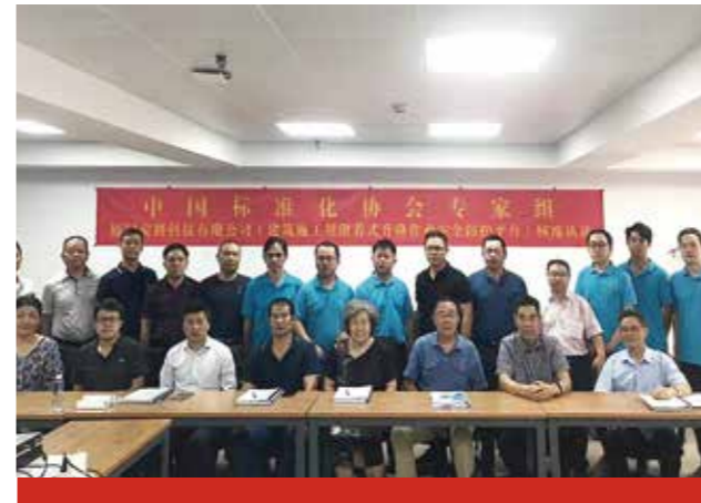
厦门安科成为省内首家、全国第二家通过建筑施工用附着式升降作业安全防护平台对标审核的企业