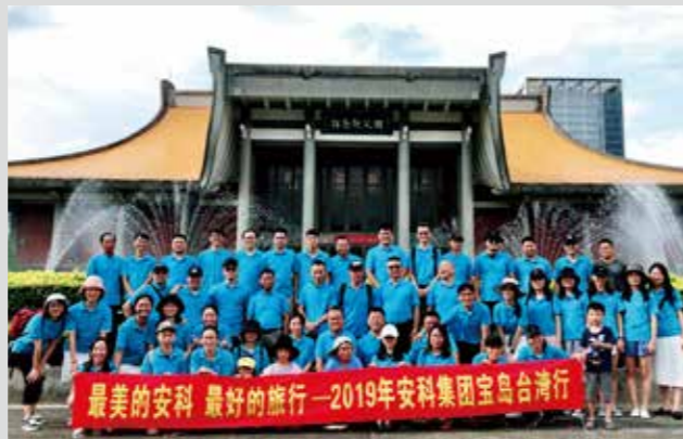
2019年厦门安科台湾团建