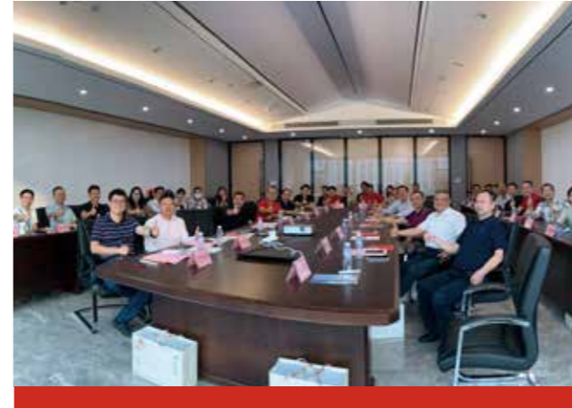
厦门安科联合中国并购公会海西并购俱乐部、中国银河证券厦门分公司在厦门安科开展“智能建造”主题沙龙活动,探索建筑行业智能化转型升级新道路