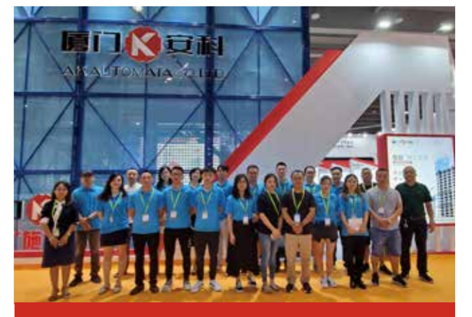
厦门安科惊艳亮相广州模板脚手架展览会,获广东南方卫视报道